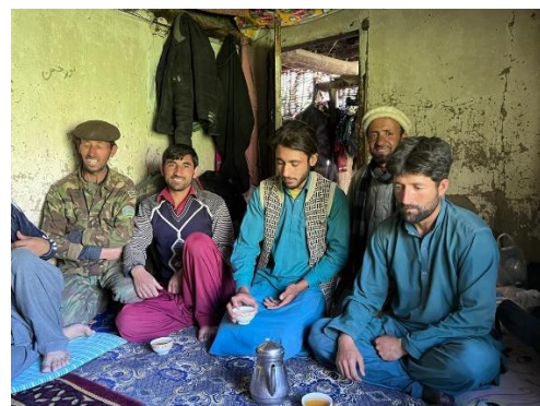
Besprechung mit Lehrern in Arandu