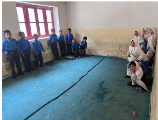
Schulzimmer der Amin Brak Public School – ohne und mit Teppichen