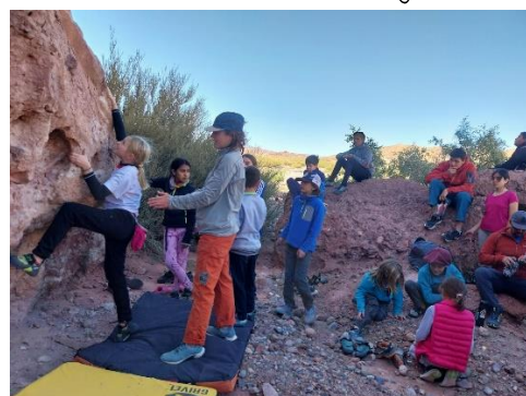
Klettertraining an Boulderfelsen