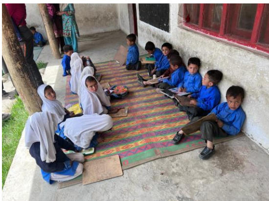
Schulstunde an der frischen Luft