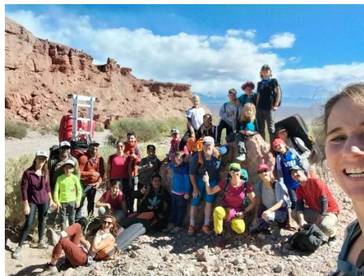
Gruppenfoto beim Besuch der Kletterschule