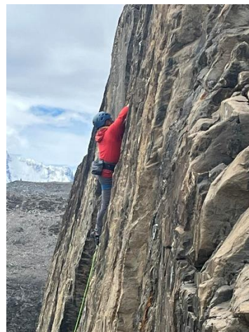
Ausbildung im Fels