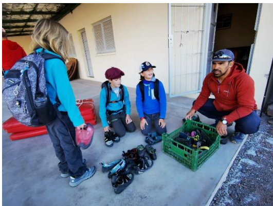
Verteilung der Kletterausrüstung