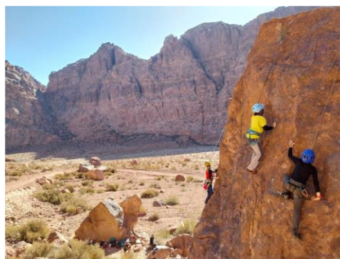
Kletterausflug der Kinder in der Region