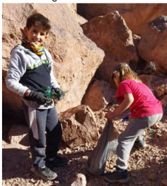
Müll sammeln in den Bergen