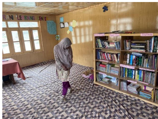
Die neue Bibliothek der Schule