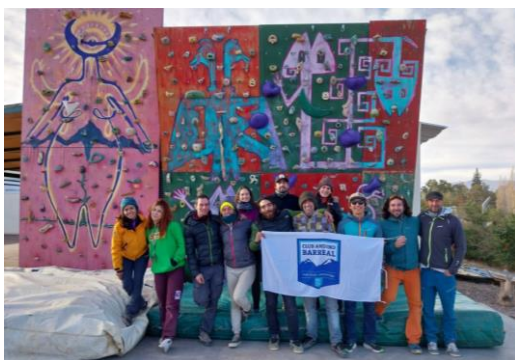
Ausbildung von Kletterlehrern