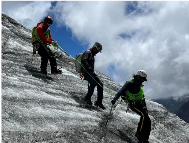
Ausbildung auf dem Gletscher