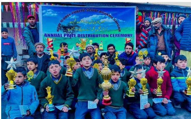
Schul-Zeremonie Dezember 2023