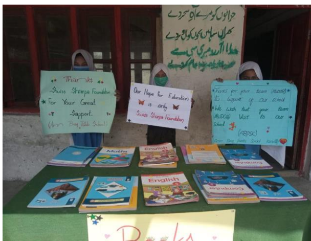
Schulbücher für die Schülerinnen und Schüler

Auch hier haben wir als Dankeschön viele Bilder von der Übergabe der Schulbücher im Sommer 2021 und von der Abschluss-Zeremonie im Dezember erhalten.