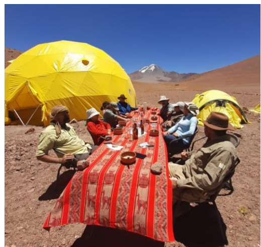
Mahlzeiten mit Blick auf den Lullaillaco, der nur ca. 5km Luftlinie vom Base Camp liegt.