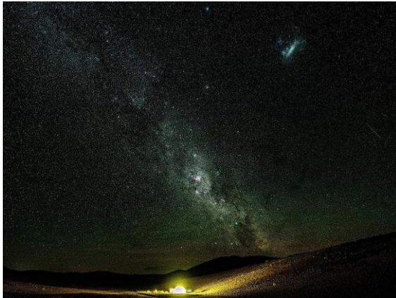
Sterne soweit man sehen kann...