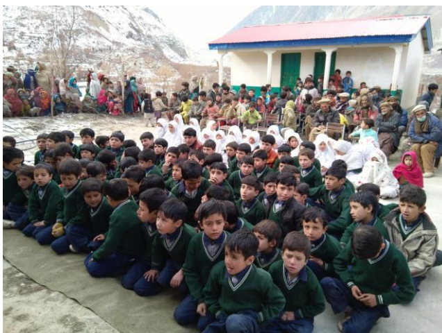
Bilder Schule und Zertifikatsübergabe im Dezember 2021