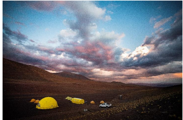
Faszinierende Landschaften am Lulluillaco