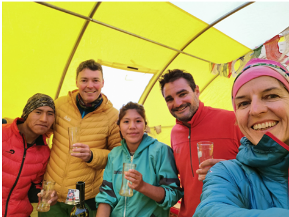
Aperitif mit unserem Sherpa-Wein 😊