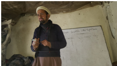
Einer der Lehrer in Arandu

Die Kosten sollen sich auf knapp USD 10'000 belaufen und das Schulhaus soll im Frühjahr 2020 das erste Mal für die Schulkinder geöffnet werden. Auch für die zusätzlichen zwei Lehrer-Honorare will unsere Stiftung in den ersten 2 – 3 Jahren aufkommen.