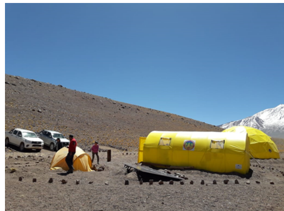
Das Base Camp auf 4'500m Höhe