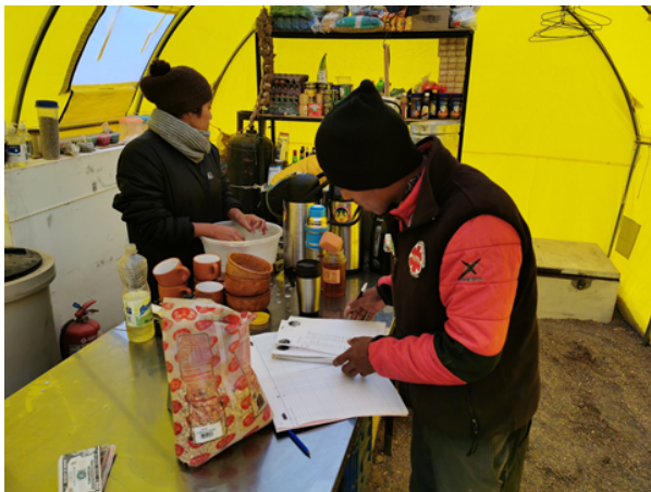
Das Team in der Küche des Base Camp