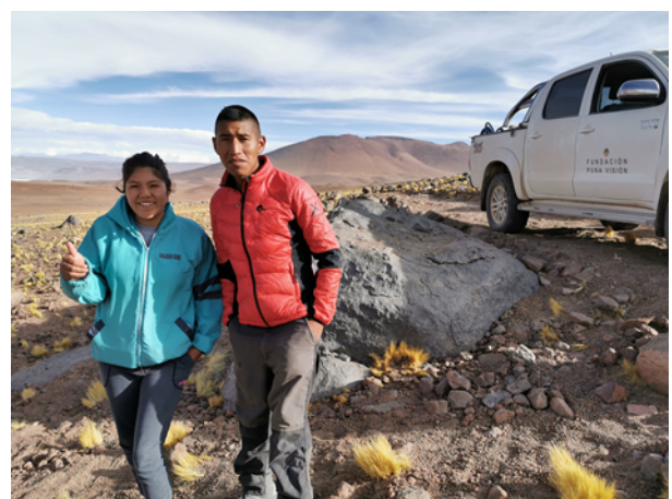
Soledad und Tiko