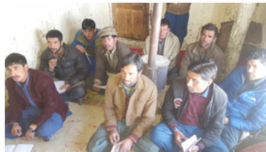
Hochträger, die English lernen