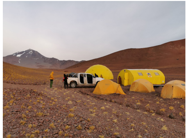
Blick via Base Camp zum