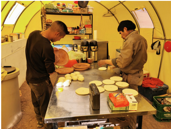
Pizza backen in der Küche des Base Camp Lulllaillaco