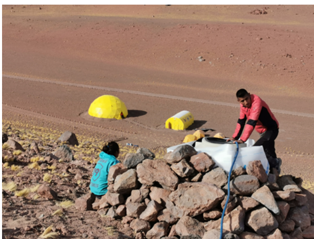
Tiko beim auffüllen des Wassertanks